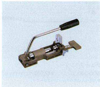
スーパーつば出し工具 (フレキパイプ用)