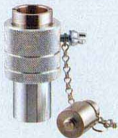
フレキパイプつば出し工具 (ハンマータイプ)