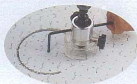
石膏ボード・シフトン プラスターボード・内装材etc.