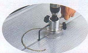
金属系サイディングタン・ブリキetc. ※金属系被削材は切削キズ防止の為布テープ等にて保護をして穴あけを行って下さい。 ※平先コンパス超硬ビット使用時の金属系被削材には別の機械にて6.0mmの鉄工ドリルで中芯に下穴をあけてください。