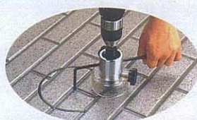
窯業系サイディング スレート・FRP・塩ビ板etc.