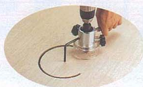
板材・合板・ベニヤ新建材etc.