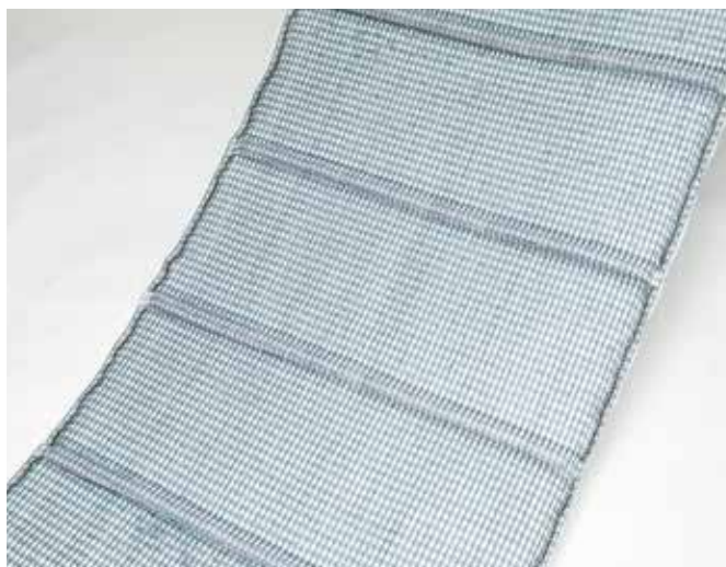
※写真はダブル ロンケットアナコンダ I-40です。