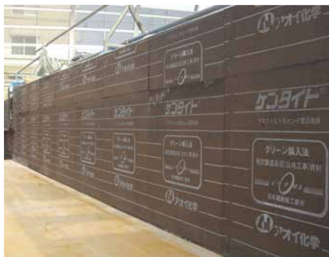
▲浄化センターの目地に使用

ケンタイトは、米国ASTM D-1751の全項目に合格し、優秀な性能を有しています。