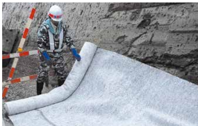
▲護岸工事にキュアマットT-10を使用