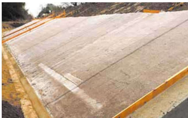
▲護岸工事にキュアマットT-10を使用