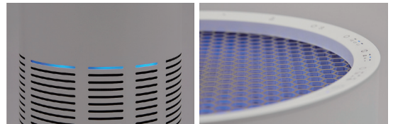
二オイ・ホコリモニター (LED3色表示) / 吸気口