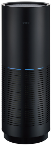
AP-C320i-IB インディゴブラック