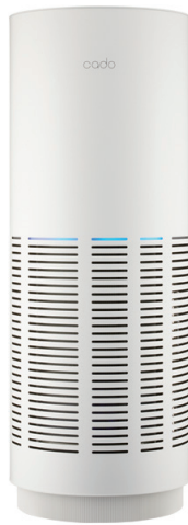
AP-C320-WH ホワイト ※IoT非対応